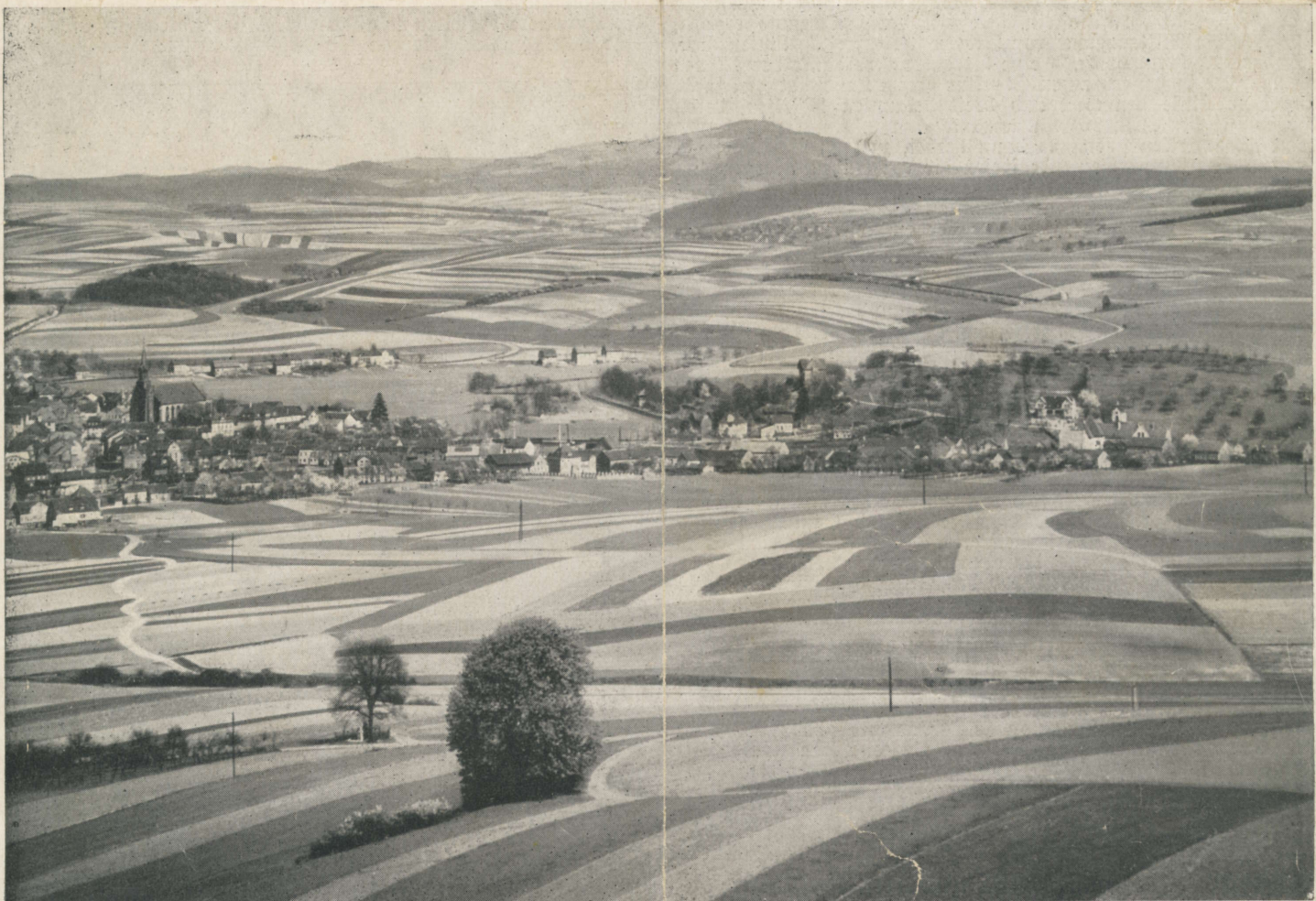
Blick vom Hoxberg auf Lebach. (Im Hintergrund erblickt man den Schaumberg.)

Bildwiedergaben von M. Wenz, Saarbrücken.