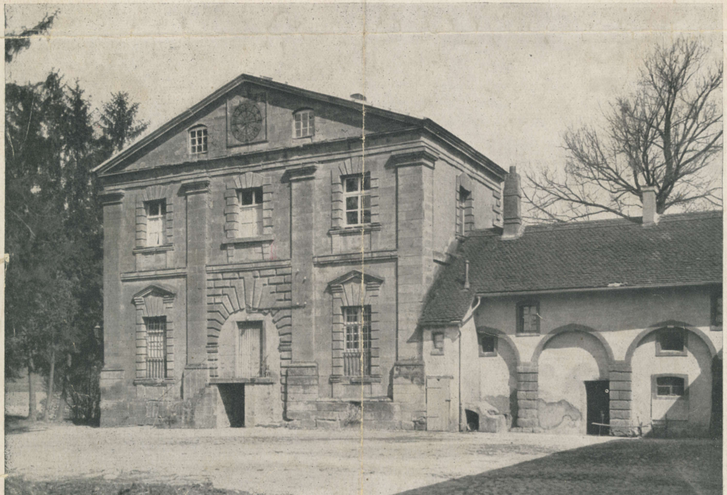
Schloß „Zur Motten“.