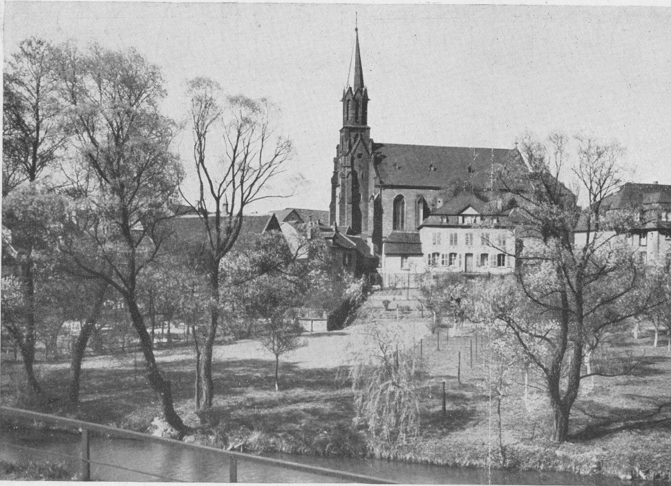
Motiv an der Thel mit Blick auf die kath. Pfarrkirche.