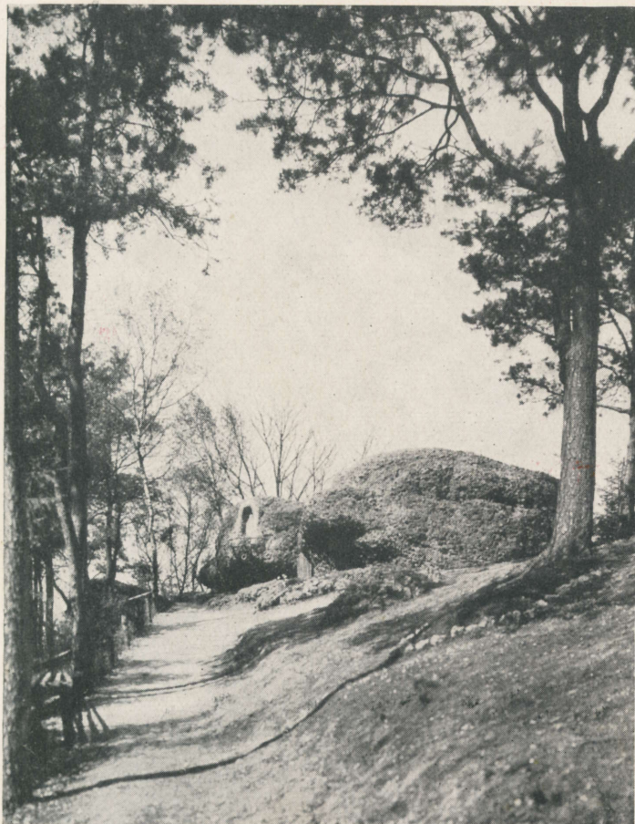
Der Kallenstein a. d. Högberg.